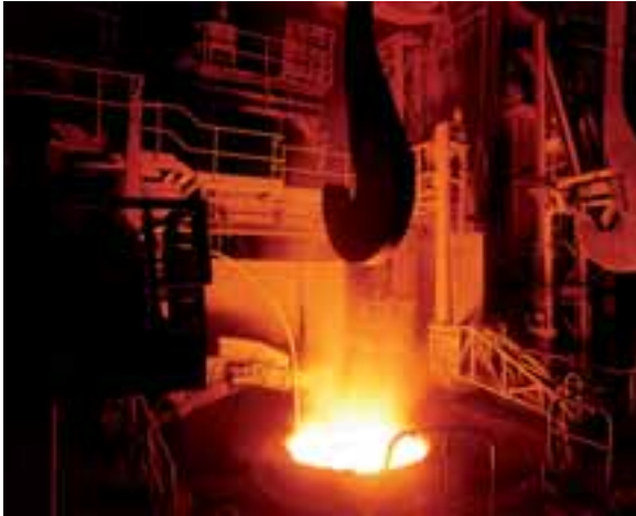
Vacuum Arc Degasser in einem Melt Shop bei Sheffield in Yorkshire

Zum Abschluss ein Bild aus einem Stahlwerk – der Vacuum Arc Degasser in einem Melt Shop bei Sheffield in Yorkshire – und eine passende Aufgabe. In diesem VAD wird der an Voranlagen erschmolzene Stahl entgast, durch Legierungszugaben auf die geforderte chemische Zusammensetzung gebracht und bis zu der gewünschten Temperatur erhitzt.