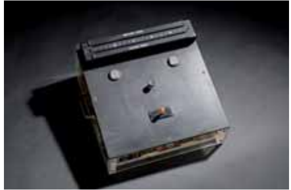
Mind Reading Machine

Er konstruierte Anfang der 1950er Jahre mit 150 Telefonrelais den ersten Schachcomputer für verschiedene Endspielsituationen, nachdem er bereits 1949 unter Verwendung des von Neumann'schen MINIMAX-Theorems die Lösungssuche für Schachzüge optimiert hatte. Später spielte er selbst sogar gegen den russischen Schachweltmeister und Ingenieur Michail Botwinnik.