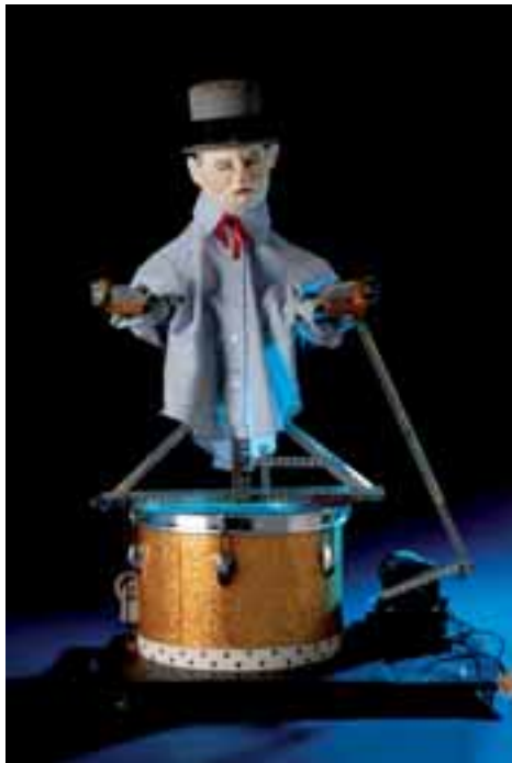
Bounce Juggler W. C. Fields

Er war eines der größten Genies des 20. Jahrhunderts, der Vater des Bits und Pionier unseres Informationszeitalters. Doch Claude Shannon zeichnete sich nicht nur durch Gedankenschärfe und Einfallsreichtum, sondern auch durch Humor und Originalität aus. Der Begründer der Informationstheorie bastelte in seiner Freizeit an Jonglierrobotern, Schachcomputern und programmierbaren Blechmäusen. Im Institut fuhr er Einrad oder jonglierte mit Keulen.