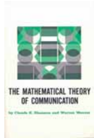
Shannons berühmtes Paper

Die Funktion der Original-Objekte ist aus konservatorischen Gründen nur in Videos zu sehen. In einem kleinen Kino werden seltene Filmstreifen gezeigt, in denen Claude Shannon einige seiner Spiel- und Denkzeuge originell erklärt. Zudem ist ein Film der Universität von Kalifornien in Berkeley zu sehen, in dem Shannon als „Vater des Informationszeitalters“ vorgestellt wird.