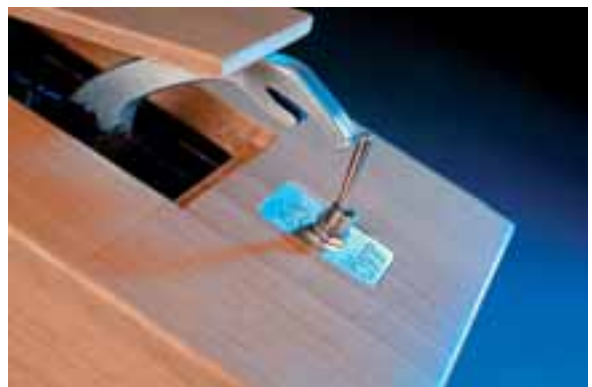
Shannons ‚Ultimative Maschine‘ (Nachbau HNF)

Im Heinz Nixdorf MuseumsForum werden die Shannon-Objekte kreisförmig in Vitrinen platziert. Das Zentrum der Ausstellung bildet die mediale Inszenierung „Signal und Rauschen“. Hier können die Besucher Signalstörungen erzeugen, Rauschen erfahren und hautnah erleben, was Shannons grundlegende Arbeiten der Nachrichtenübertragung praktisch bedeuten. Um die ausgestellten Spielzeuge des Erfindergenies in einen wissenschaftlichen Zusammenhang zu stellen, wurde zu jedem Objekt ein spezielles Szenario, ein Gegenüber, geschaffen. Das reicht von kuriosen Taschenrechnern über den Mars-Rover Nanokhod, ferngesteuerte Hubschrauber, Exponate zur Spieltheorie bis hin zur legendären „Ultimativen Maschine“ Shannons, deren Original zwar verloren ging, die aber in einem aktuellen Nachbau des HNF in Funktion gezeigt wird. Ihr einziger Zweck besteht darin, sich immer wieder selbst auszuschalten.