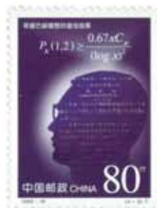
Chen Jing Run (1933–1996), auf dieser chinesischen Briefmarke abgebildet mit einer der Schätzformeln für die Anzahl der Primzahlzwillinge, konnte eine gemilderte Form der Goldbachschen Vermutung beweisen.

Knapp 60 Jahre später verbesserte Chen Jing Run (1933–1996) das Ergebnis von Brun. Statt zweier 9-Fastprim-